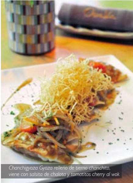
Chanchigyoza Gyoza relleno de tierno chanchito, viene con salsa de chalota y tomatitos cherry al wok