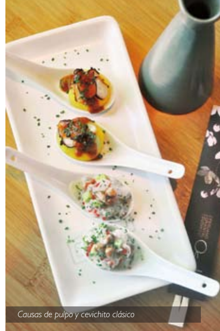
Causas de pulpo y cevichito clásico

Suman a este festival de platos los Cevichitos (6 unidades), Causas al estilo Osaka (2 Unidades), Clásicas, Especiales, Ceviches al estilo Osaka, Tiraditos al estilo Osaka, Ensaladas y Postres. ■