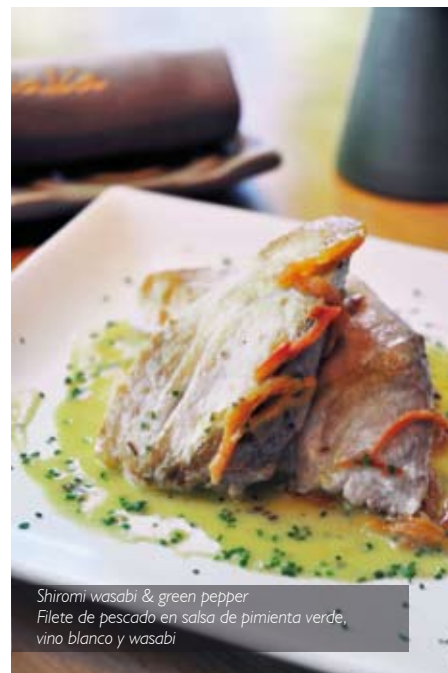
Shiromi wasabi & green pepper Filete de pescado en salsa de pimienta verde, vino blanco y wasabi