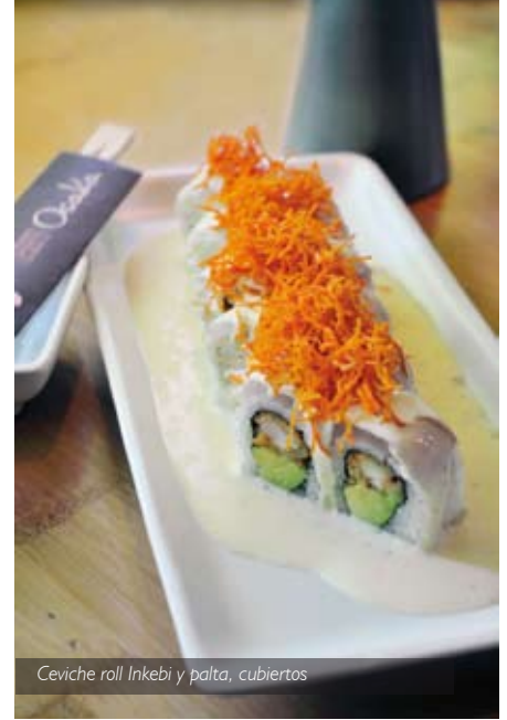
Ceviche roll Inkebi y palta, cubiertos

La carta del Osaka de Santiago, que posee una extensa oferta de platos, mantiene una relación en un 70% con su símil de Lima y Buenos Aires, y próximamente con el nuevo Osaka de México, conservando una identidad