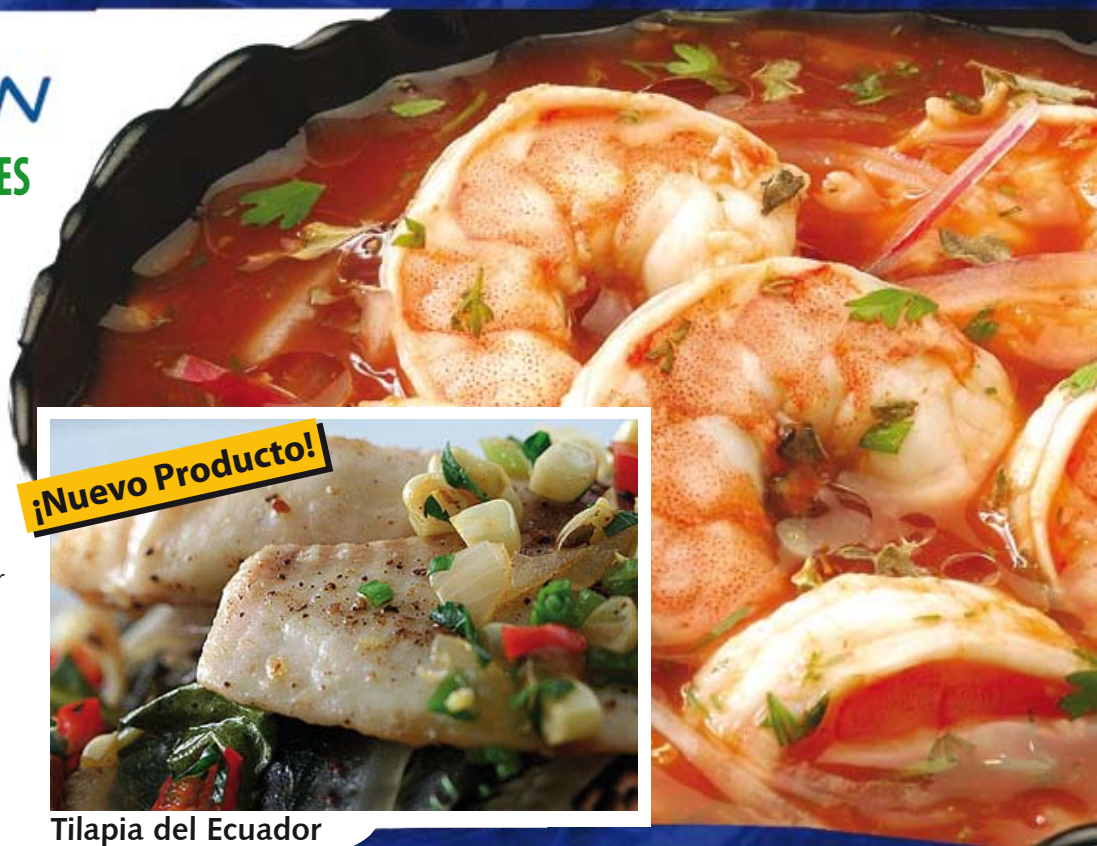
Tilapia del Ecuador

Cel. 09-742 78 48 WWW.EMPAGRAN.CL sancamaron@empagran.com