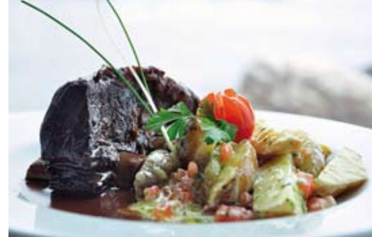
Asado de tira al vino tinto: asado de tira cocinado al vino tinto, acompañado de papas semilla a la crema con queso roquefort, ciboulette y tomate