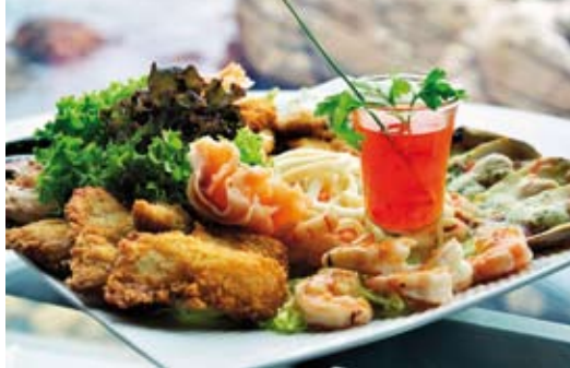
Degustación de mariscos (para compartir): selección de mariscos: camarones, ostiones, pinzas de jaiba, machas gratinadas, calamares apanados, pulpo y locos