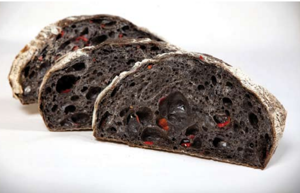
Pan campesino negro de pimiento piquillo y sal de maras

brioche, un baguette y un tipo de pan focaccia, también llamado fugazza, al cual se incorporó dentro de la masa un licuado de cebolla, pero que a diferencia del verdadero focaccia, de sólo cebolla, tiene otro tipo de sabores como queso de cabra, nueces, cebolla blanca salteada. También hay un chancay, un pan suave, como una coliza con capas, que se daba cuando mi bisabuela vivía y que me gustaba mucho. La riqueza de insumos en el Perú ha generado una variedad de panes campesinos tradicionales y que se hacen en horno de piso. A éstos se le han agregado cereales andinos, como la quinoa de colores, kiwicha, cañihua y un poco de linaza. Otro ejemplo es el trabajo que hacemos con la masa de pandoro, una masa suave parecida al italiano panettone que la adaptamos en distintos moldes (triangular, financiero, etc.), y a la cual le agregamos tres tipos de ajíes: crema de rocoto, ají picado y ají limo salteado; todo eso da un bocado delicado y un grato sabor a ajíes. O un brioche con la forma tradicional, al que le agregamos un porcentaje concentrado de chicha morada. Al final, a este pan morado le adicionamos frutos secos, confitados, y un poco de canela que hace recordar nuestra mazamorra morada, que es suave. Este tipo de pan tiene un sabor dulce por dentro y aroma a canela”.