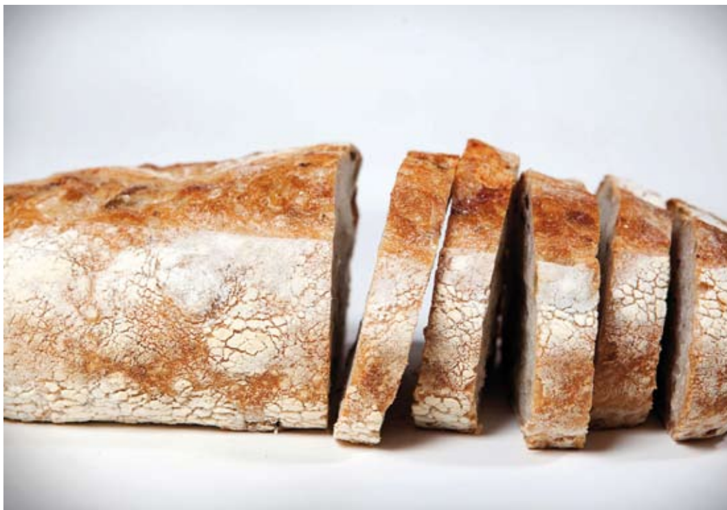
Pan de campaña de aceitunas negras, tocino y queso mantecoso en rodajas

“Cuando me preguntan por qué me gusta más ser panadero que cocinero, respondo que es porque me gusta mucho el arte y siento cada pieza de pan como si fuese una escultura. Se va moldeando, cambia de color, se rellena. En esto el vapor ayuda en un sentido y la cámara de fermentación en otro. Depende de cómo lo haces, de cuánto tiempo ocupas, para al final obtener lo que se quiere” asegura el chef.