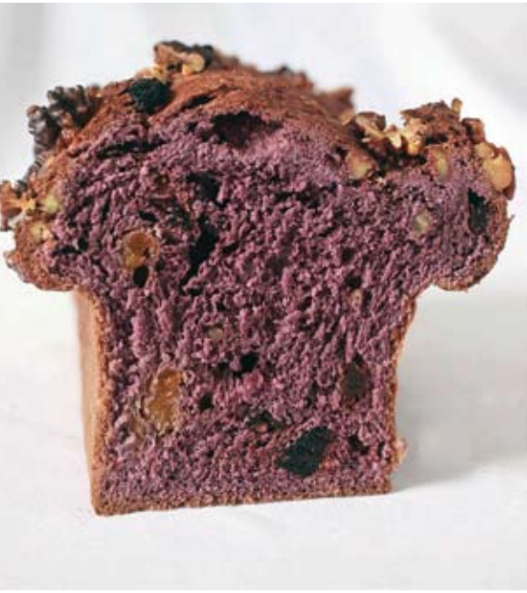
Brioche de maíz morado y frutos secos confitados