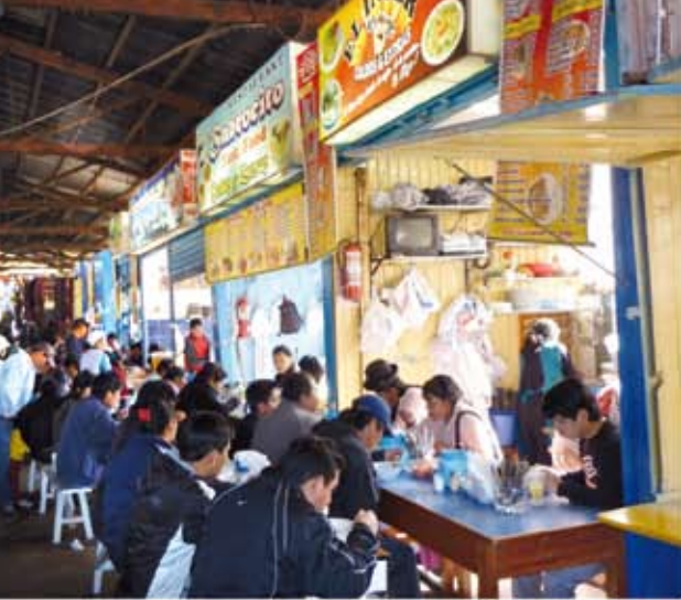
Gastro-empresarios: la comida es placer y necesidad de la cual muchos dependen en nuestro país