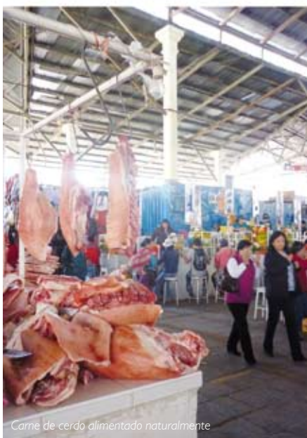
Carne de cerdo alimentado naturalmente

Cuzco: último bastión de la resistencia Inca e indiscutible capital turística del Perú. Esta deslumbrante ciudad abre alegremente sus puertas a curiosos visitantes quienes tienen la oportunidad de maravillarse -y disfrutar- de su compleja historia, impecable arquitectura y sustanciosa comida, siendo esta última el resultado de la nutrida variedad y envidiable riqueza genética de la multiplicidad de productos oriundos que ofrece el ande peruano. Destacamos merecidamente a sus rústicos quesos, crujientes panes, majestuosos choclos, turgentes papas, medicinales plantas y coloridos vegetales, entre muchos más. Sin duda, una infinita lista de magníficos insumos, todos ellos enmarcados en un interactivo, mágico y vasto universo cultural llamado mercado. Acompañennos en la presente edición a descubrir el fascinante encanto del Mercado Central del Cuzco, reflejo, legado y fusión de la preciosa amalgama cultural gastronómica que nos dejó lo mejor de dos mundos.