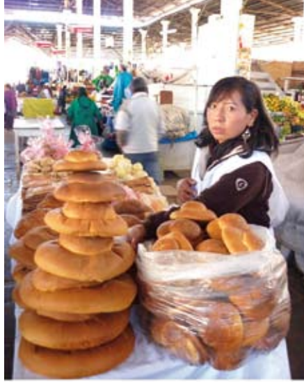
Planificada Matty y horneados andinos de excepción