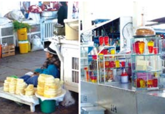
Los quesos andinos: Divertidas gelatinas ponen color legado y fusión de dos culturas.