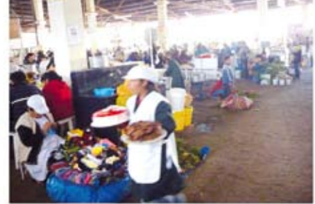
Un mercado en movimiento. Mujeres de emprendimiento