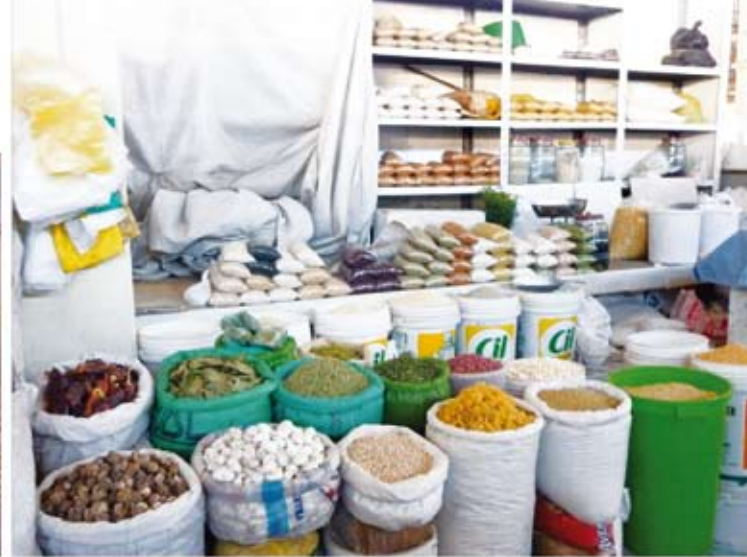
Legumbres, papas secas, chuño, lentejas, papa moraya y otras maravillas