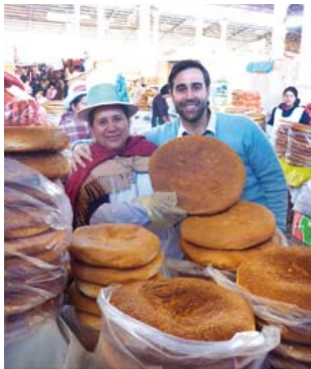
Señora Julia compartiendo su saber-hacer en materia de panes