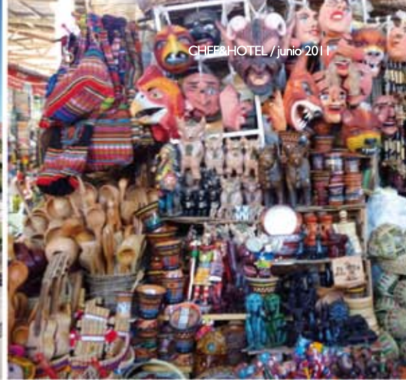
Artesanía, instrumentos musicales, canastas, tejidos e implementos de cocina. El ingenio y creatividad peruana son nuestro mayor capital sostenible