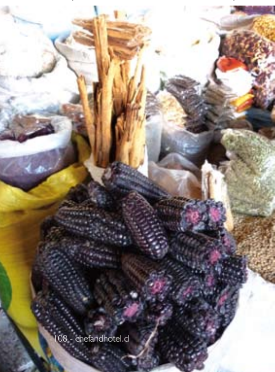
Cómplices del sabor de la Chicha Morada: canela y maíz