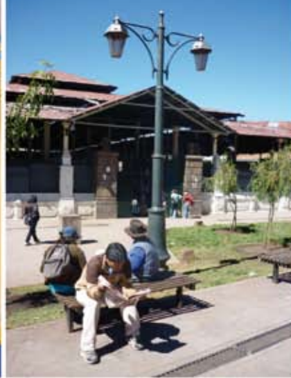
Ingreso principal Mercado Central del Cuzco