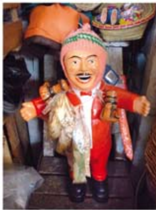
El "Ekeko": abundancia, bienestar y buena suerte