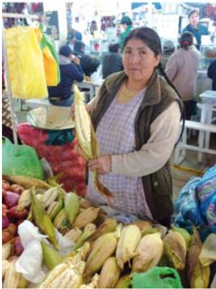
Choclos del Valle del Urubamba: otra dimensión en sabor