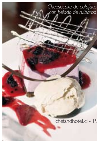
Cheesecake de calafate con helado de ruibarbo