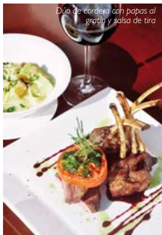
Dúo de cordero con papas al gratin y salsa de tira