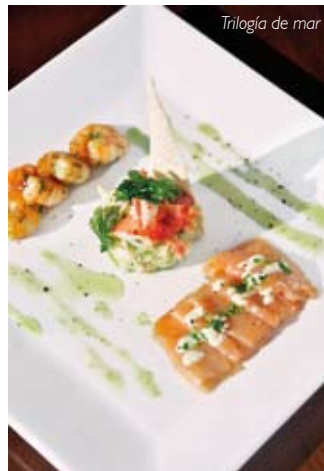
Trilogía de mar

La carta, de corte sencillo, se enmarca principalmente en un concepto Grill & Wine. En ella se pueden escoger entradas como “Ostiones y centolla gratinada al chardonnay ($4.900); “Carpaccio mar y tierra con selección de lechugas y dressing de mostaza” ($3.900); o una “Ensalada de habas, tocino crispy y aromas de menta ($1.900); entre otras. Aunque también está el “Pescado del día” ($6.900), básicamente la especialidad son las carnes a la parrilla. En este segmento se pueden elegir variados cortes como un “Asado de tira” de 400 gramos ($4.900); “Lomo de cerdo grillado” de 300 gramos ($4.900); “Lomo vetado” y “Lomo liso”, de 300 gramos ($6.500 c/u); “Entrecot”, de 400 gramos ($6.900); o un “Cordero chuleta corte francés” ($9.000). Un atractivo adicional es el “Cordero asado magallánico” ($9.000, dos cortes), que el chef prepara al palo de viernes a domingo, y que ha sido para los turistas argentinos y nacionales, una oportunidad imperdible. Seis opciones de acompañamientos a $1.500 cada uno, hacen la perfecta armonía del plato. En cuanto a los postres, el restaurant propone recetas con productos de la zona como “Selección de tres sabores de helados ($1.900); “Tarta de berries tibia con helado calafate” ($2.400); y “Parfait de damascos y salsa de ruibarbo” ($2.900), entre otros. ■