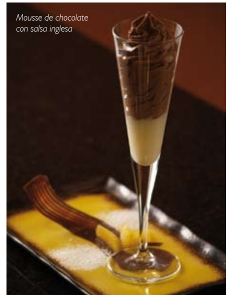
Mousse de chocolate con salsa inglesa