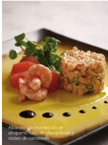
Albacora con mantequilla de alcaparra, rabu de champiñones y risoteo de camarones