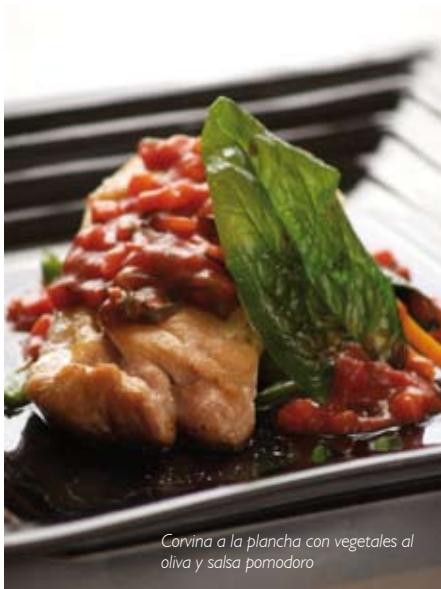
Corvina a la plancha con vegetales al oliva y salsa pomodoro

Molina 76 - Valparaíso Teléfono: (56-32) 21 33600 Fax: (56-32) 21 33700 reservas-vps@dahoteles.com www.dahoteles.com