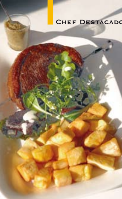
Picaña al estilo paulista acompañada de yuca frita