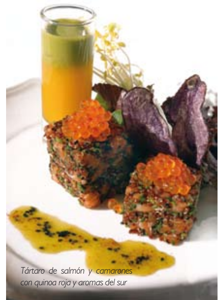
Tártaro de salmón y camarones con quinoa roja y aromas del sur