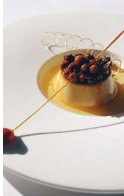
Suave flan casero con murta sureña al almíbar