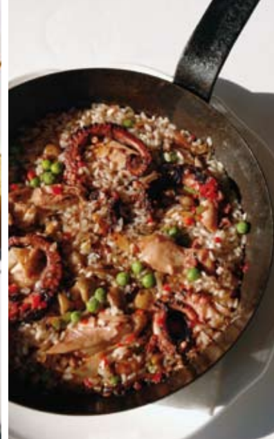
Paella de pollo ahumado y pulpo

agrupación Les Toques Blanches a la cual pertenece, organización que según el chef, en un principio mantuvo una posición muy hermética frente a la incorporación de chefs jóvenes, condición que hoy ha cambiado, según señala.