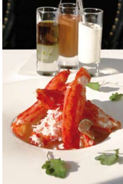
Centolla Austral y sus tres salsas