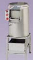
Peladoras de Papas