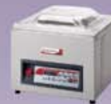
Selladoras al Vacío