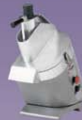
Procesadores de Alimentos