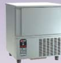
Abatidores de Temperatura