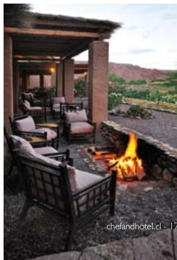
chefandhotel.cl - 17