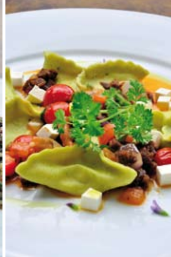
Tricornio de cachiyuyo relleno con pastelera y queso de cabra, en pebre tibio de charqui de llama

La carta cuenta con más de 130 platos aproximadamente, que se van presentando en un menú de seis opciones a la hora del almuerzo, y seis a la hora de la cena. La carta se recambia durante el año, en primavera-verano y otoño-invierno. Presente en esta son los platos vegetarianos, tofu casero, hesitan (una carne vegetal a base de proteínas del trigo), pastas frescas y pastas vegetales de quínoa, mientras que en las carnes está el lomo, filete, el pato y el cordero. Mientras que en pescados, se escoge lo mejor que llega en el día.