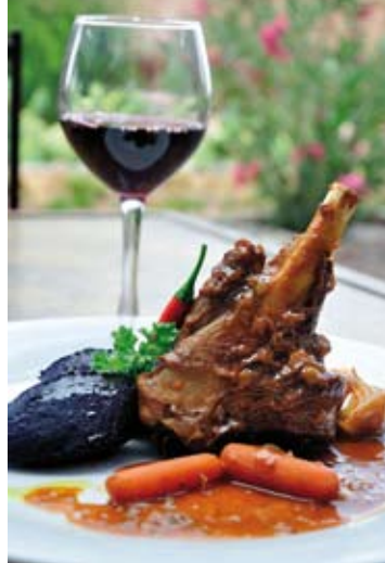
Garrón de cordero criolla, estofado con puré de papas moradas