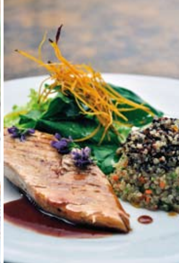
Pollo en salsa de arpe de chañar, con una ensalada tibia de quínoa roja, negra y blanca, flores de alfalfa y crocante de papa camote