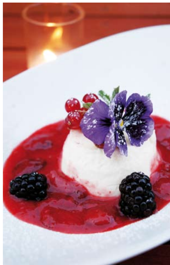
Panna cotta de la casa