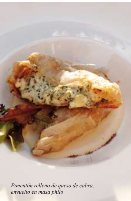
Pimentón relleno de queso de cabra, envuelto en masa philo

En lo que fuera el comedor de la casona – donde actualmente se encuentra el restaurante –, Durán recibía cada jueves, a la hora de almuerzo, a destacados políticos y diversos personajes de la sociedad santiaguina. A diferencia del Pasta e Vino de Valparaíso, éste cuenta con 14 mesas en su interior y diez en la terraza, y su capacidad es de 60 personas por cada rotación. El sello de elegancia del Aubrey se refleja en sus sillas y mesas, las cuales han sido diseñadas por Alejandro Valdés. Otro detalle son las lámparas de Tom Dixon y la barra de bronce y madera, que permiten mantener el mismo encanto y calidez de su hermano porteño.