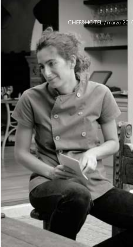
CHEF&HOTEL / marzo 2010