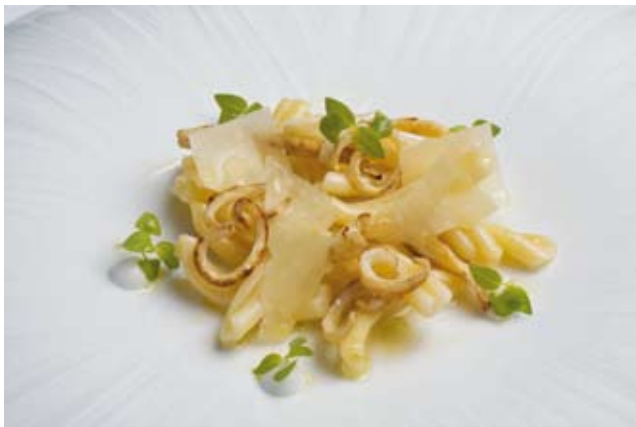
Pasta cocinada en agua de calamares con cohombros de mar