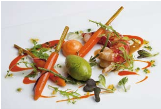
Carabinero asado con zanahorias y coriandro